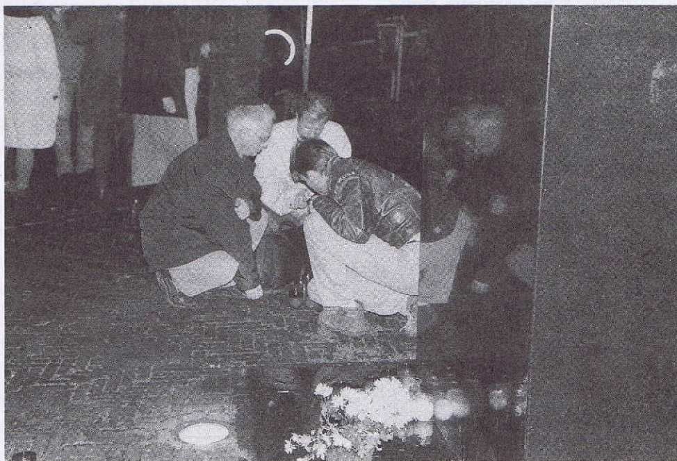
Kaarsen bij het Joods verzetmonument

Al deze bijeenkomsten werden belegd door een grote verscheidenheid van organisaties: zowel die zich bezighouden met de strijd tegen racisme als die van