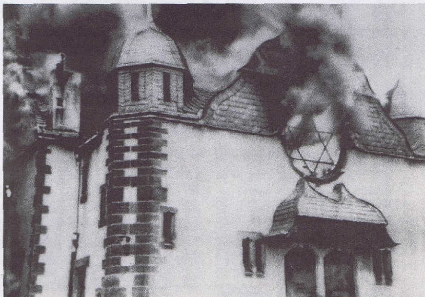
Een synagoge in brand in de nacht van 9 op 10 november 1938